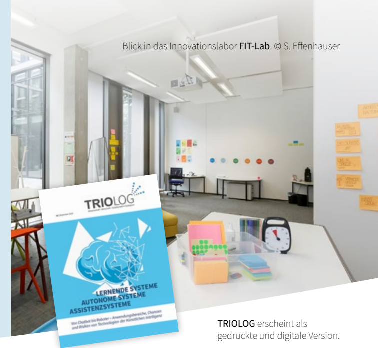
Blick in das Innovationslabor FIT-Lab.