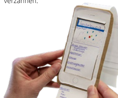
Im machbar Innovationslabor spielt das Arbeiten mit Prototypen eine große Rolle.

Im machbar Innovationslabor sowie dem FIT-Lab werden Workshops mit Partnern aus Wirtschaft und Gesellschaft durchgeführt, um den Transfer mit Forschung und Lehre zu verzahnen.